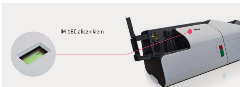
IM-16C z licznikiem

IM-16 usprawnia przepływ dokumentów w firmie, co przyspiesza procesy biznesowe i podnosi efektywność działania. W rezultacie firma odnosi korzyści z szybszego i usprawnionego przetwarzania przychodzących dokumentów, a jej personel dysponuje dodatkowym czasem, który może przeznaczyć na wykonywanie ważniejszych prac. Otwieracz IM-16 jest skutecznym sposobem na podniesienie konkurencyjności firmy.